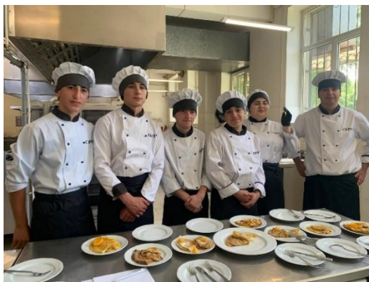
Լուսանկար. Ֆրանս-հայկական մասնագիտական ուսումնական կենտրոնի խոհարարական լաբորատորիա, 22.05.2024