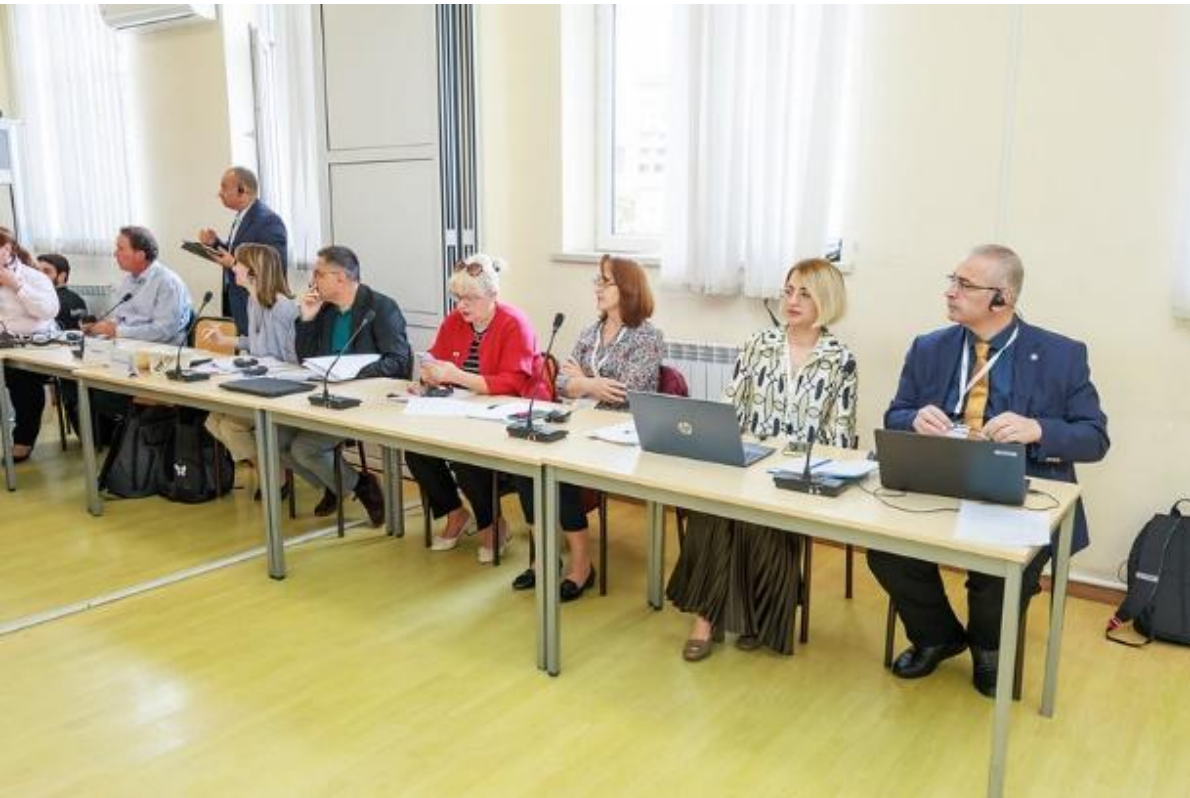
Լուսանկար. արտաքին գործընկերները Ֆրանս-հայկական մասնագիտական ուսումնական կենտրոնում, 22.05.2024