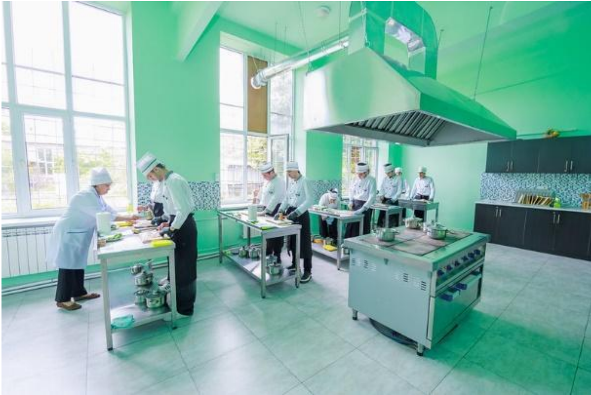
Երևանի տարածաշրջանային N1 պետական քոլեջի ուսանողները լաբորատորիայում, 22.05.2024