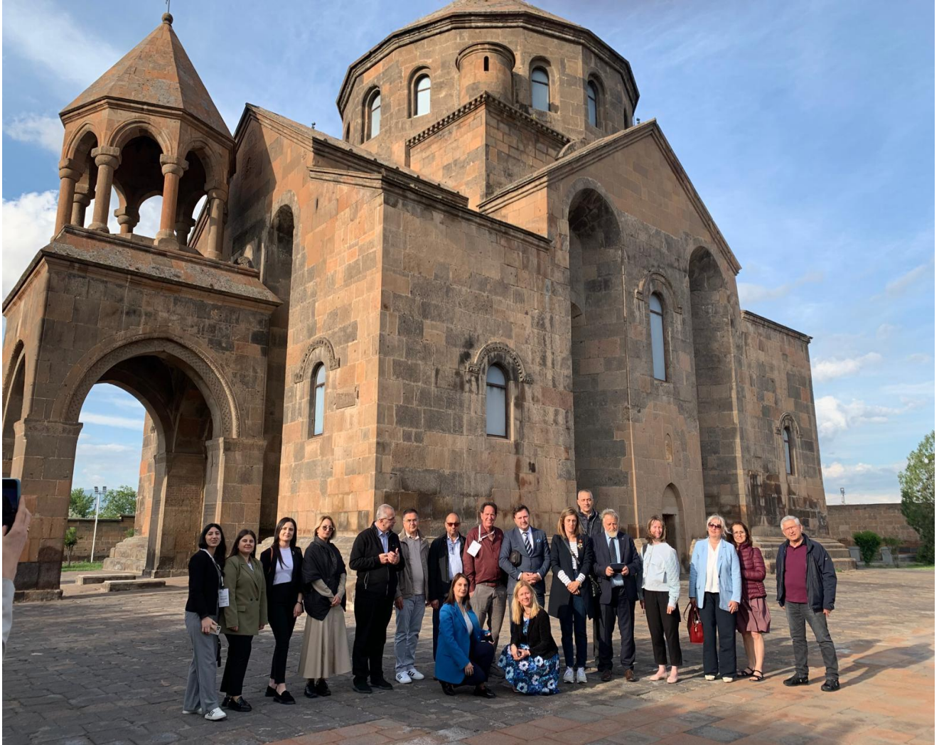
Լուսանկար. խմբակային լուսանկար, 21.05.2024