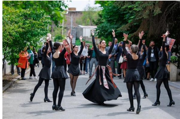
Լուսանկարներ. Երևանի տարածաշրջանային N 1 պետական քոլեջի ուսանողներ, 22.05.2024