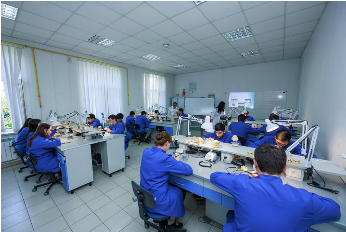
Լուսանկար. Ֆրանս-հայկական մասնագիտական ուսումնական կենտրոնի ուսանողները լաբորատորիայում, 22.05.2024