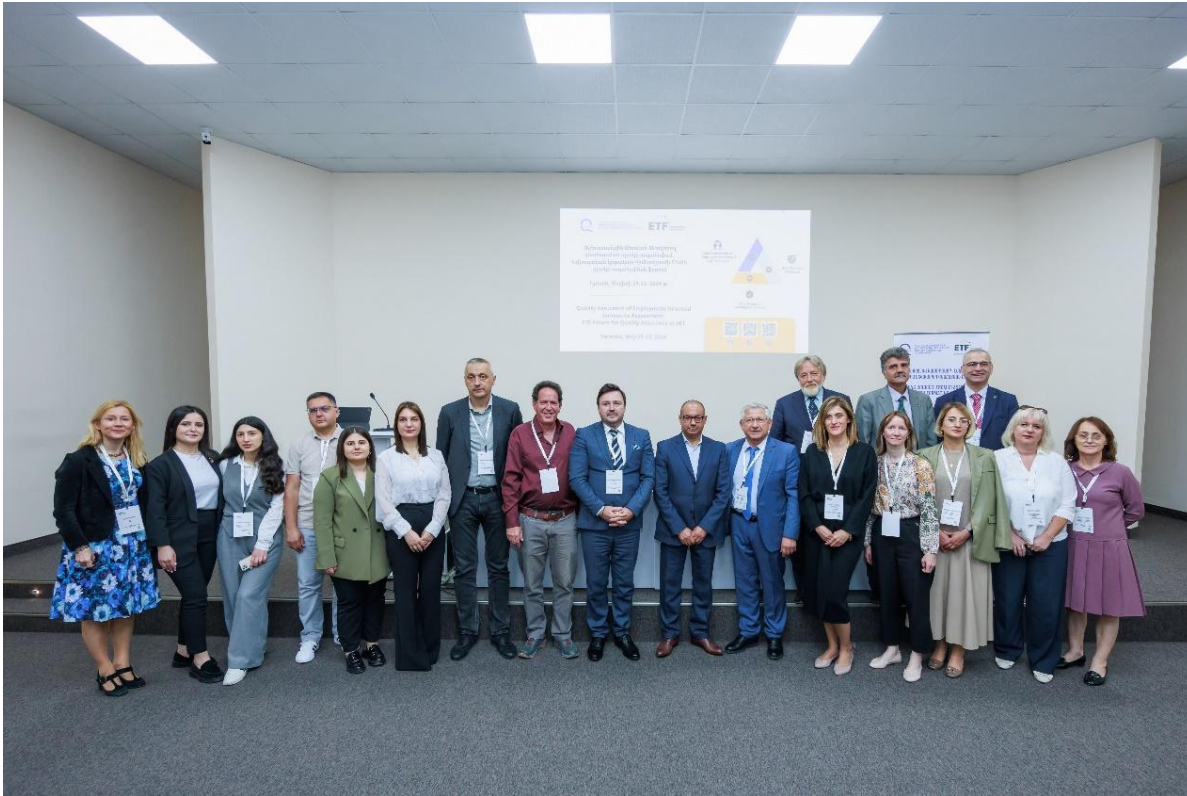
Խմբային լուսանկար. ֆորումի բացման արարողությունը Երևանի Մխիթար Հերացու անվան պետական բժշկական համալսարանում (ԵՊԲՀ), 21.05.2024

Գործընկերային այցը հնարավորություն է տալիս ստանալու արտաքին արձագանք, որի նպատակն է հյուրընկալող երկրին աջակցել որակի ապահովման համակարգի զարգացման գործում: ՈԱԱԿ-ը ֆորումի անդամ այլ երկրների արտաքին գործընկերներին առաջարկել է արձագանք տրամադրել՝ պարզելու, թե արդյոք որակի արտաքին ապահովման միջոցառումներն արդյունավետորեն են ազդում ձևավորող գնահատման որակի վրա: Առանձնահատուկ կարևորություն է տրվել ձևավորող գնահատման գործընթացում գործատուների ներգրավվածությանը: ՈԱԱԿ-ը գործընկերներին առաջարկել է նաև տրամադրել խորհրդատվություններ՝ ուղղված ՄԿՈԻ համակարգում ձևավորող գնահատման լավագույն փորձերի արդյունավետ տեղայնացմանը: