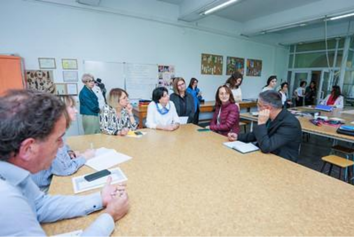
Լուսանկար. արտաքին գործընկերները և ուսանողները Ֆրանս-հայկական մասնագիտական ուսումնական կենտրոնի կարի արտադրության տեխնոլոգիայի լաբորատորիայում, 22.05.2024