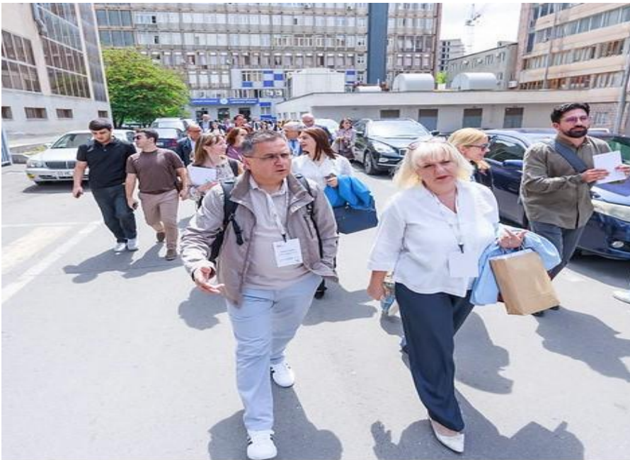
Լուսանկար. գործընկերների ժամանում Երևանի Մխիթար Հերացու անվան պետական բժշկական համալսարանի քոլեջ, 21.05.2024

Նախապատրաստական փուլում այցն իրականացնող գործընկերների առջև դրված հիմնական խնդիրը եղել է ՈԱԱԿ-ի պատրաստած Ազգային համատեքստը ներկայացնող զեկույցի ու կից փաստաթղթերի ուսումնասիրությունը, առաջադրած հարցերի դիտարկումը: