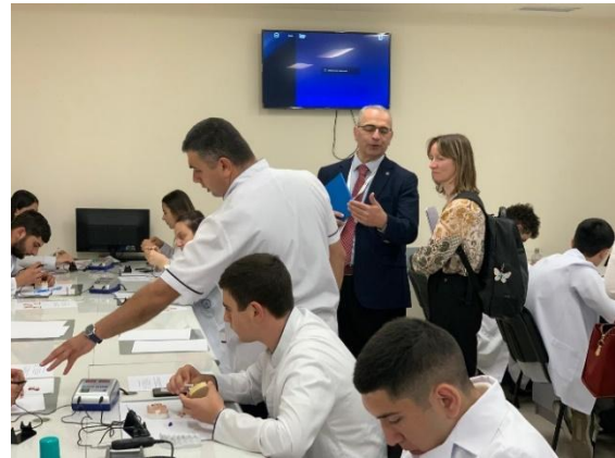
Լուսանկարներ. ձախից աջ՝ մասնագիտական գրույց-քննարկումներ Երևանի Մխիթար Հերացու անվան պետական բժշկական համալսարանի քոլեջի «Ատամնատեխնիկական գործ» կրթական ծրագրի դասախոս-գործատուների և ուսանողների հետ, 21.05.2024